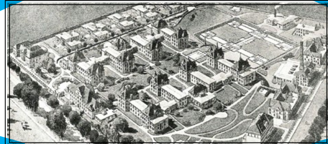
Schaubild Krankenhaus Westend - Charlottenburg 1907

Besichtigung, musikalischer Ausklang und Get-together mit Imbiss